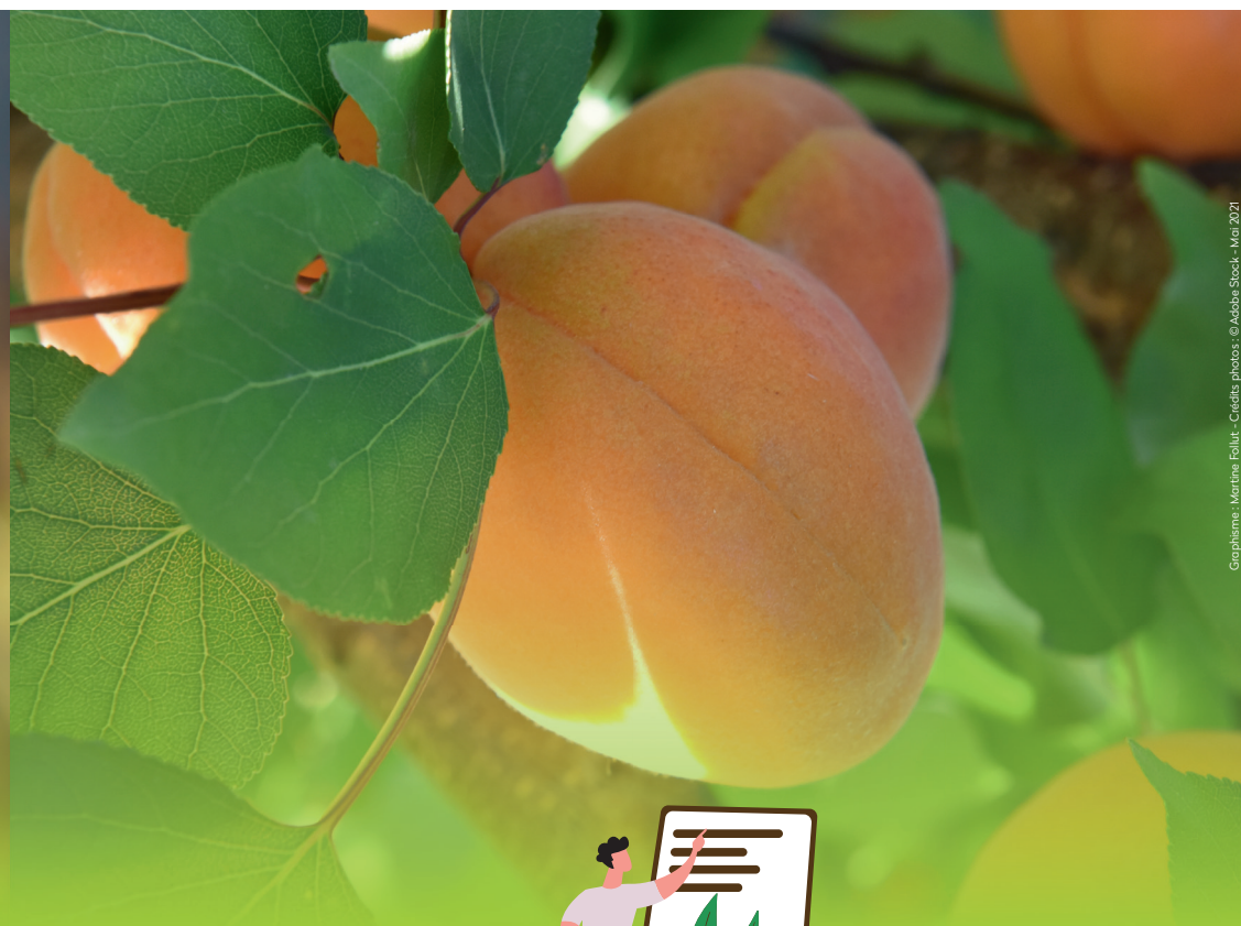
Graphisme : Marine Follet - Mai 2021